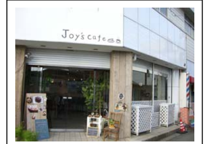
お店は、阪急電車踏み切り近くです。 以前はパン屋さんだったそうです。