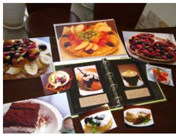
季節のフルーツを使ったケーキも好評です。