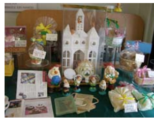
お城も店長手作りです。