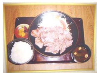
食べ応えありのステーキ定食(¥1200)